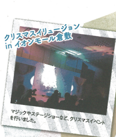
クリスマスイルミネーション in イオンモール倉敷