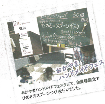
おかやまハンドメイドフェスタ