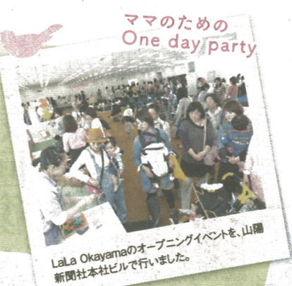
ママのための One day party