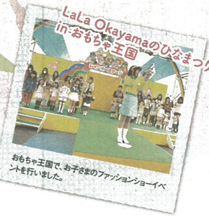
LaLa Okayamaのひなまつり in-おもち王国

LaLa Okayamaは、楽しいイベントを開催してきました。これからも子育てママがHAPPYになれるような楽しいイベントを開催します! ご期待ください!